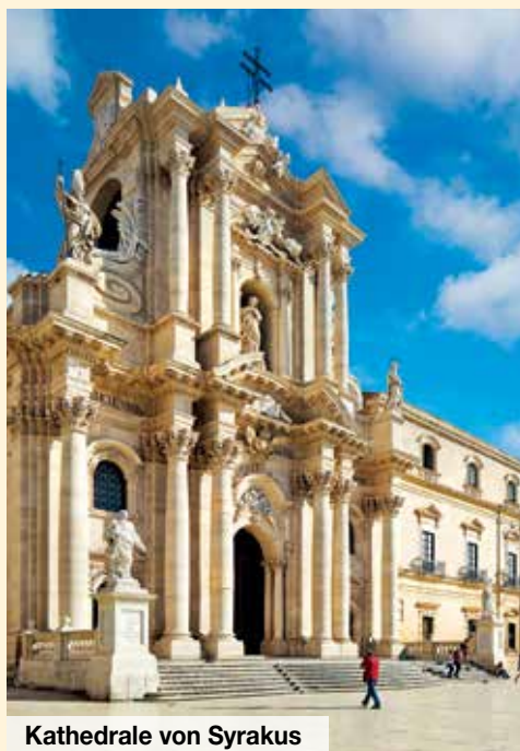
Kathedrale von Syrakus