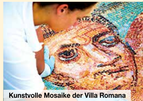
Kunstvolle Mosaik der Villa Romana