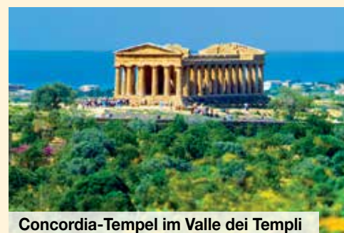
Concordia-Tempel im Valle dei Templi