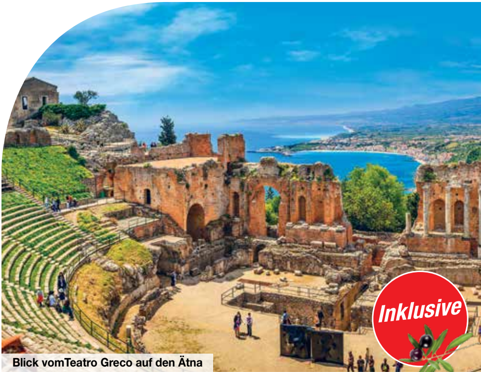
Blick vom Teatro Greco auf den Ätna