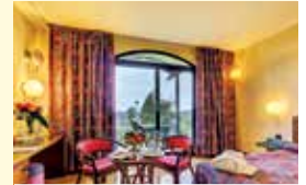
z. B. Hotel Caesar Palace, Giardini Naxos, Zimmerbeispiel