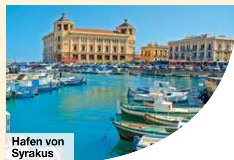
Hafen von Syrakus