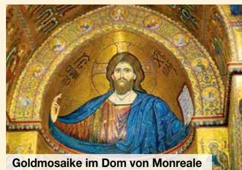
Goldmosaike im Dom von Monreale

fahren vom Hotel zum Hafen von Milazzo am nördlichen Zipfel Siziliens und setzen nach Lipari über. Sie können die Altstadt oder den archäologischen Park besichtigen und in den Geschäften der Kleinstadt shoppen. Danach geht es übers Meer an bizarren Klippen und Grotten vorbei nach Vulcano, nach römischer Mythologie die Schmiede des Gottes Vulcanus. Die Insel macht ihrem „explosiven“ Namen alle Ehre: Schon von weitem grüßt der knapp 400 Meter hohe Gran Cratere, über brodelnden Erdspalten liegt leichter Schwefelgeruch und die Strände glänzen lavaschwarz.