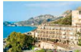
z. B. Hotelanlage Antares Olimpo – Le Terrazze, Letojanni