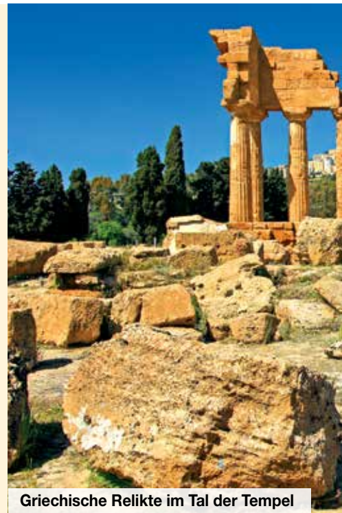
Griechische Relikte im Tal der Tempel