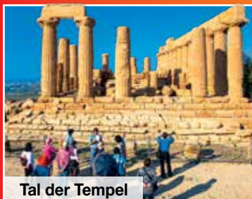
Tal der Tempel

Antike Schätze, sonnenverwöhnte Strände und mediterrane Naturparadiese!