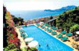
z. B. Hotelanlage Antares Olimpo – Le Terrazze, Letojanni

Verbringen Sie nach Ihrer Sizilien-Rundfahrt eine entspannte Strandwoche in einem der beliebten Badeorte Letojanni oder Giardini Naxos. An der sonnenverwöhnten Ostküste Siziliens locken herrliche Buchten und ein ganzjährig mildes Klima.