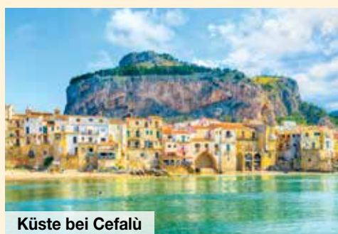
Küste bei Cefalù