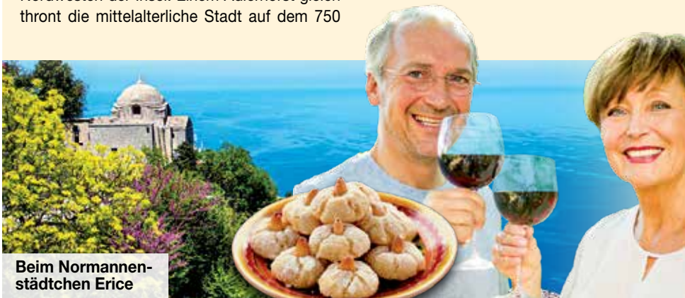
Beim Normannenstädtchen Erice

Tag 6 Dieser Tag steht ganz im Zeichen der Antike und monumentalen Sensationen im UNESCO-Welterbe. Ihre erste Station ist das großartige Tal der Tempel, Herzstück einer der eindrucksvollsten Ausgrabungsstätten Siziliens. Die teilweise noch sehr gut erhaltenen griechischen Tempel zeugen von der Größe, Macht und kulturellen Hochblüte der damaligen griechischen Stadt. Auch Johann Wolfgang von Goethe schildert in seinem Werk „Italienische Reise“ seinen Besuch im Valle dei Templi. Entdecken Sie zum Beispiel den Concordia-Tempel und die wunderschöne Agora, die sich über mehrere Terrassen erstreckt. Von den steinernen Zeu-