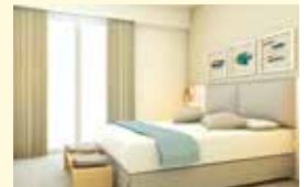
z. B. Hotel Albatros Zimmerbeispiel