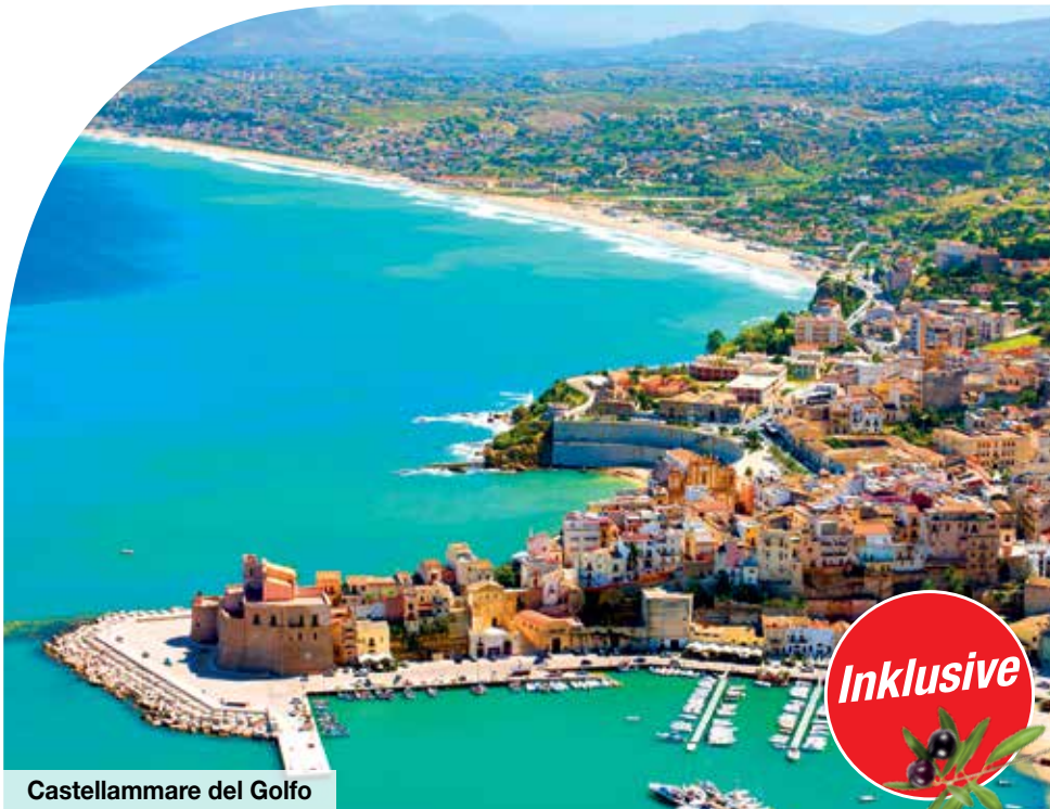
Castellammare del Golfo