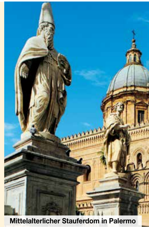
Mittelalterlicher Stauferdom in Palermo