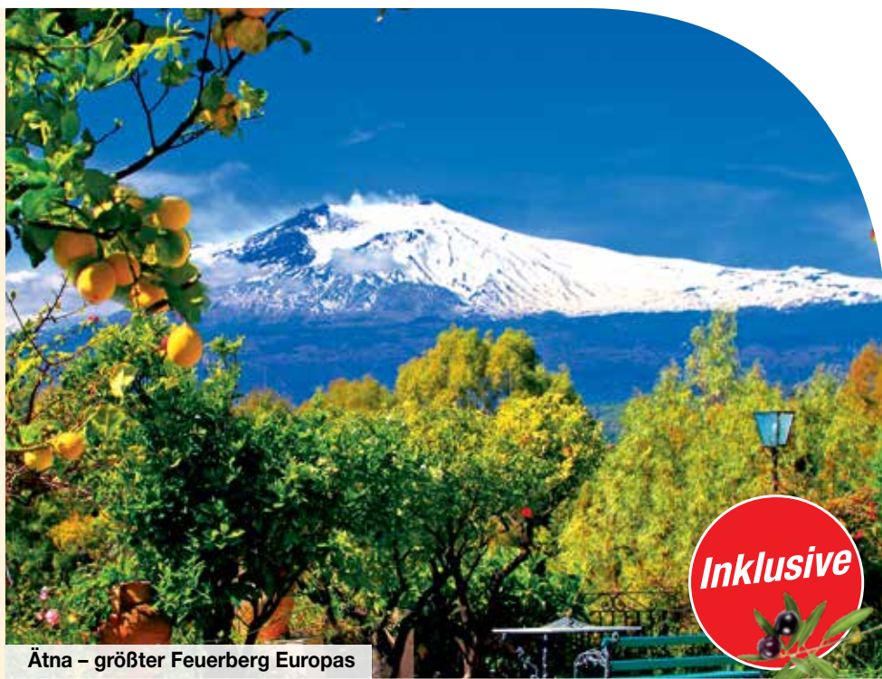
Ätna – größter Feuerberg Europas