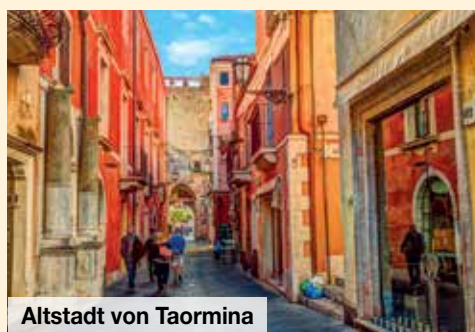
Altstadt von Taormina