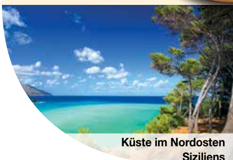
Küste im Nordosten Siziliens