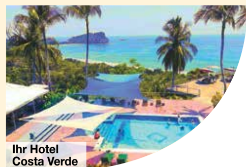
Ihr Hotel Costa Verde